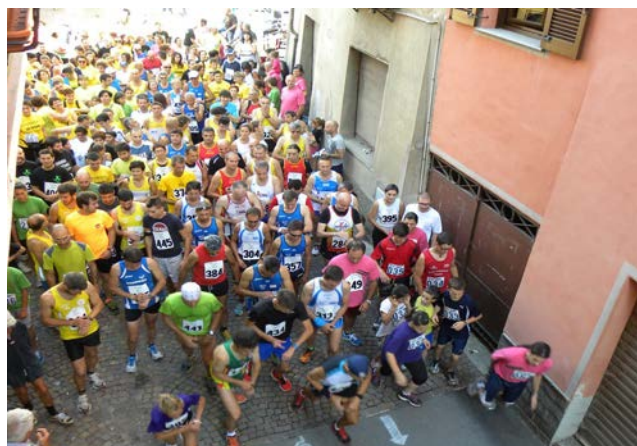
PARTENZA EDIZIONE 2017

Dopo la gara vi è la possibilità per i concorrenti e gli accompagnatori di PRANZARE presso il campo sportivo/area manifestazioni.